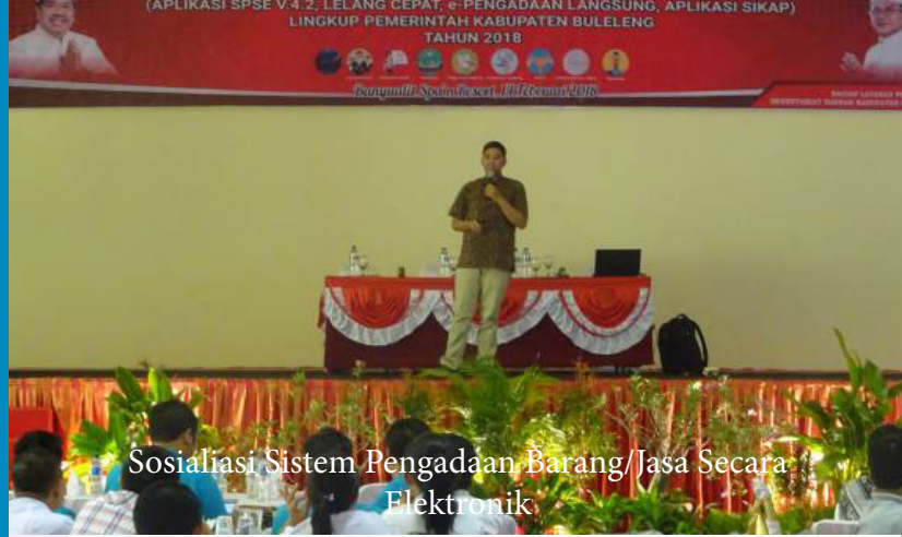
Sosialisasi Sistem Pengadaan Barang/Jasa Secara Elektronik