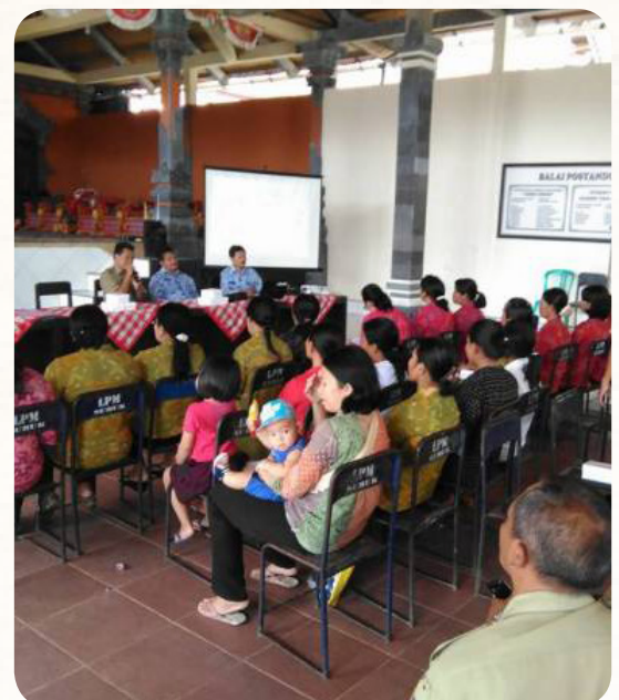
Sosialisasi Program Keluarga Berencana di Desa Subuk Kecamatan Busungbiu

Terwujudnya kesetaraan gender dan terpenuhinya hak anak secara sistematis dan berkelanjutan sesuai dengan peraturan Menteri Pemberdayaan Perempuan dan Perlindungan Anak