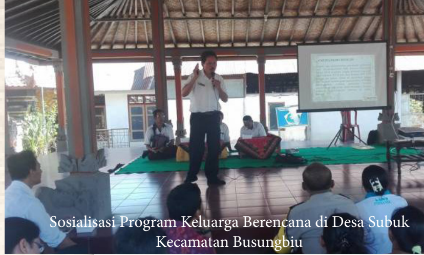
Sosialisasi Program Keluarga Berencana di Desa Subuk Kecamatan Busungbiu

Pengendalian Penduduk, Keluarga Berencana, Pemberdayaan Perempuan dan Perlindungan Anak